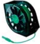
XTL30 predlžovací uzemňovací kábel 30 m Objed. č. 2007-997