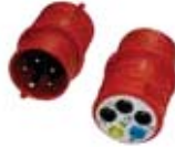
3-fázový adaptér 16A DE-CEE16-S (zástrčka) Objed. č. DE-060 89,- €*