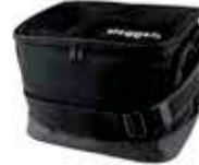
MFT transportná taška-veľká Objed. č. 1007-463 73,- €*