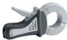
MVC1010 napätové kliešte CAT IV 600V kategória Objed. č. 1010-518 365,- €*