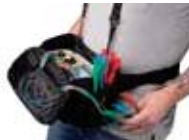
Testovacia a transportná taška pre MFT1800 sériu Rozmery: (~240x160x70mm) Objed. č. 1006-408 70,- €*