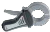
MCC1010 prúdové kliešte CAT IV 600V kategória Objed. č. 1010-516 365,- €*