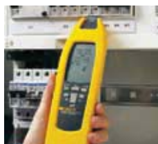
Vyhledávání pojistek/jističů a osazení obvodů