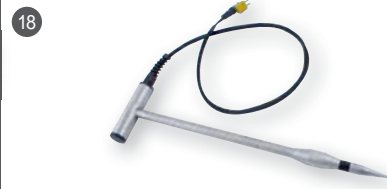
18 GSF 50TF (110 cm) obj. č. 601312

(bez teplotního senzoru) pro měření do hloubky 40 cm popř. 107 cm, včetně 1 m připojovacího kabelu, určen pro štepku, dřevitou vlnu, třísky, seno, slámu, obilí, piliny atd.