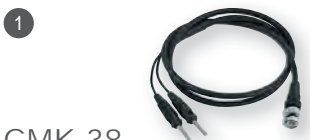
1 GMK 38 obj. č. 601261