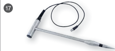
17 GSF 50 (110 cm) obj. č. 601306

měřicí kleště pro měření dých a slabých výrobků ze dřeva (do tloušťky ~ 10 mm)